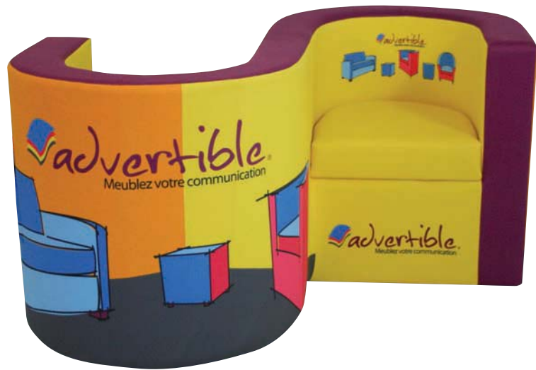
Fauteuil en vis à vis Toronto